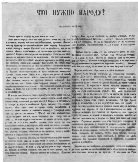
Страница прокламации «Что нужно народу?».